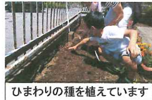
ひまわりの種を植えています