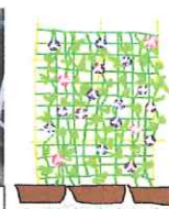
グリーンカーテンの「朝顔」もう咲いています