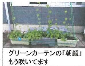
グリーンカーテンの「朝顔」もう咲いています